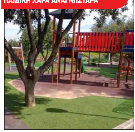
ΠΑΙΔΙΚΗ ΧΑΡΑ ΑΝΑΓΝΩΣΤΑΡΑ