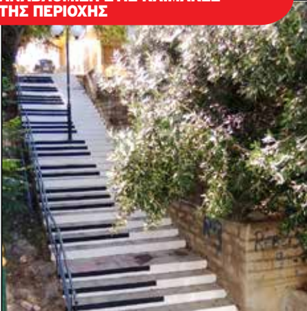
ΑΝΑΒΑΘΜΙΣΗ ΣΤΙΣ ΚΛΙΜΑΚΕΣ ΤΗΣ ΠΕΡΙΟΧΗΣ