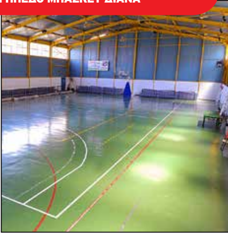
ΓΗΠΕΔΟ ΜΠΑΣΚΕΤ ΔΙΑΝΑ