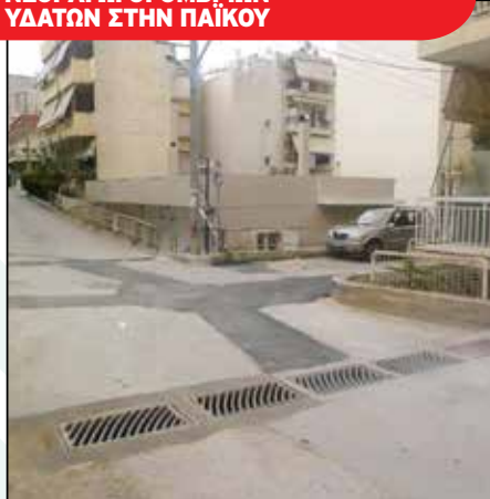
ΝΕΟΙ ΛΩΓΓΟΙ ΟΜΒΡΙΩΝ ΥΔΑΤΩΝ ΣΤΗΝ ΠΑΪΚΟΥ