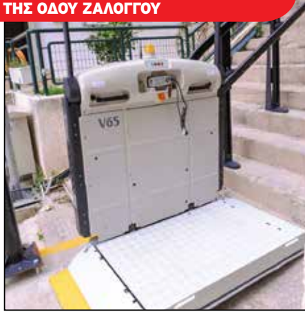
ΑΝΑΒΑΤΟΡΙΟ ΓΙΑ ΤΟΥΣ ΚΑΤΟΙΚΟΥΣ ΤΗΣ ΟΔΟΥ ΖΑΛΟΓΓΟΥ